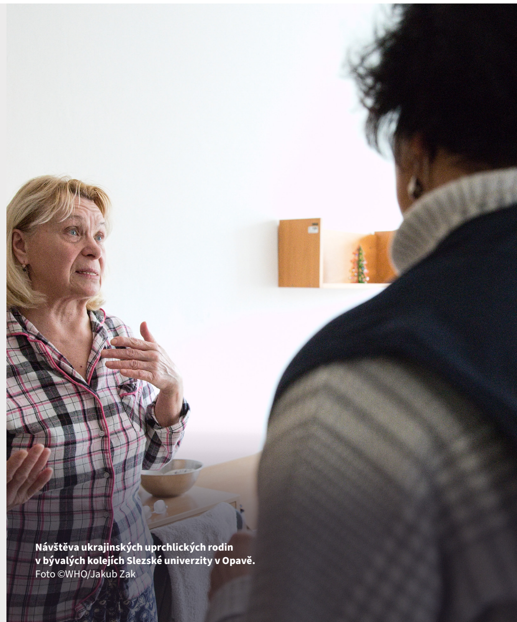
Návštěva ukrajinských uprchlických rodin v bývalých kolejích Slezské univerzity v Opavě.

Nové strategické priority WHO pro ČR v oblasti zdraví budou uvedeny ve společné Strategii pro spolupráci pro období 2024–2030. Jde o střednědobý rámec, který reaguje na priority vlády ČR nejen v oblasti zdravotnictví. Strategie popisuje, jak bude WHO přispívat k realizaci národního zdravotního a rozvojového programu, a to v souladu s globálními a regionálními prioritami a cíli, včetně Cílů udržitelného rozvoje (SDGs), a pracovními programy WHO. Nová strategie by měla sloužit také jako rámec pro plánování operačních aktivit v půlročních cyklech, aby WHO mohla co nejlépe podpořit veřejné zdraví v ČR. Dlouhodobá spolupráce existuje také v oblasti životního prostředí a zdraví, zejména vzhledem k tomu, že Česko hostilo předchozí 6. ministerskou konferenci WHO o životním prostředí a zdraví.